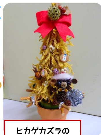
ヒカゲカズラの クリスマスツリー

その他：活動の様子を撮影した写真等は、広報やホームページなどに利用させて頂く場合がございますので、ご了承下さい。