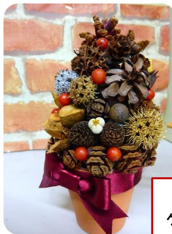
きのみの クリスマスツリー